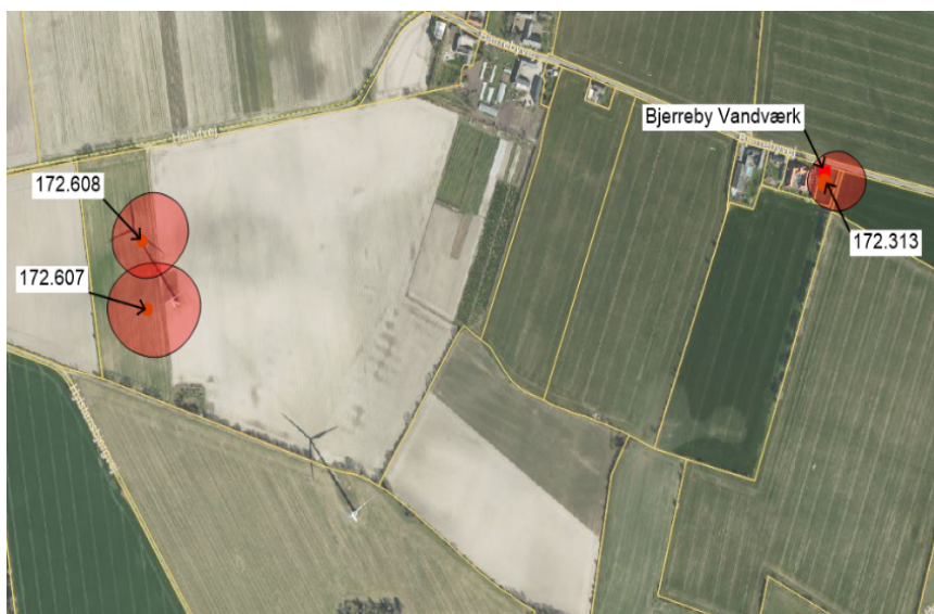
Figur 1. Oversigt over borer og tilhørende BNBO'er ved Bjerreby Vandværk. BNBO er markeret med rødt.