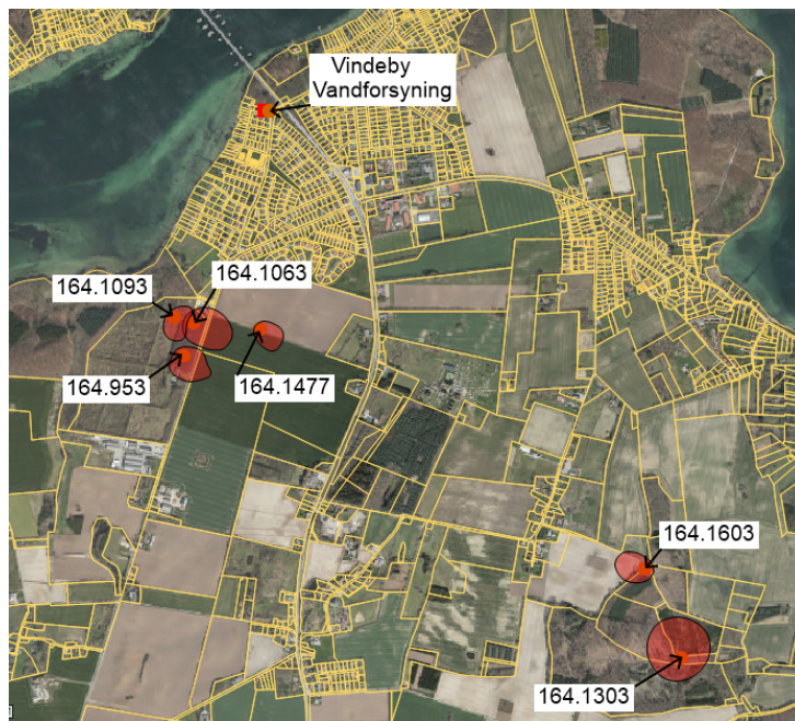
Figur 3. Oversigt over borer og tilhørende BNBO'er ved Vindeby Vandforsyning. BNBO'er er markeret med rød.